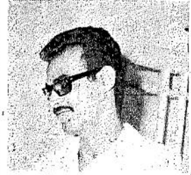
بقلم : قاسم حداد